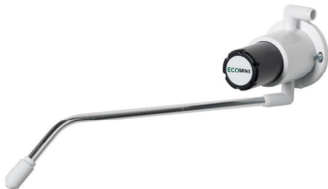
verze s 300 mm ramenem