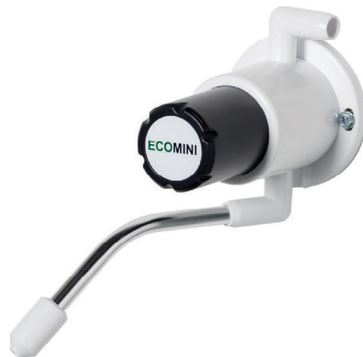
verze s 125 mm ramenem

Tento dávkovač, který lze snadno připevnit na zeď, je vybaven nekapajícím ramenem z hliníku nebo nerezové oceli.